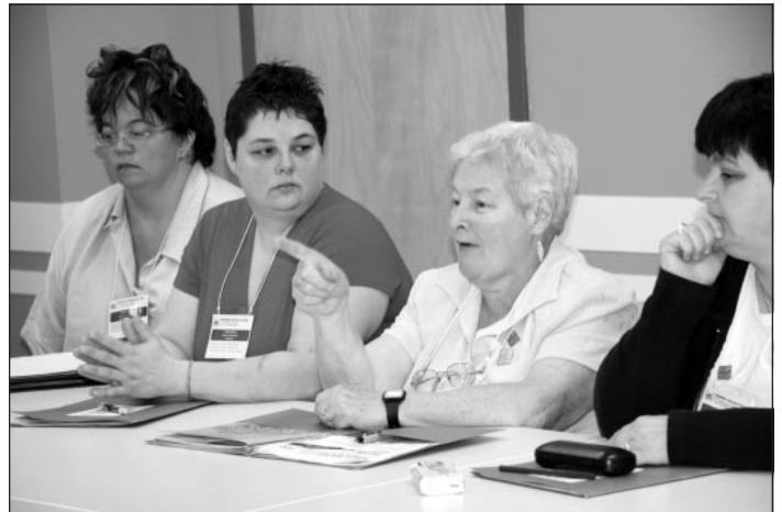
Quelques-unes des 200 personnes qui ont participé au dernier congrès. Tel que promis, les résolutions que le congrès n'a pas eu le temps de traiter ce printemps ont été étudiées par le conseil d'administration au mois d'août.

Il a été résolu de mettre en dépôt la partie « a » car nous avons déjà adopté une proposition précise au 7 e congrès réclamant l'installation de salles de lavages, si possible dans les logements, sinon sur les étages. La partie « b » a été rejetée car il ne serait pas réaliste de demander la gratuité des laveuses/sècheuses et la partie « c » a été rejetée car le paiement par pièces de monnaie demeure une solution pratique dans beaucoup de petits offices.