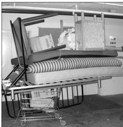
Déménager est une aventure compliquée. Heureusement, la SHQ recommande aux offices de ne pas faire payer les trois mois de préavis lors d'un déménagement vers une résidence ou d'un décès.

mettre fin au bail et de ne plus exiger le paiement du loyer dès que la personne commencera à payer un loyer en centre d'hébergement qu'il soit public ou privé.