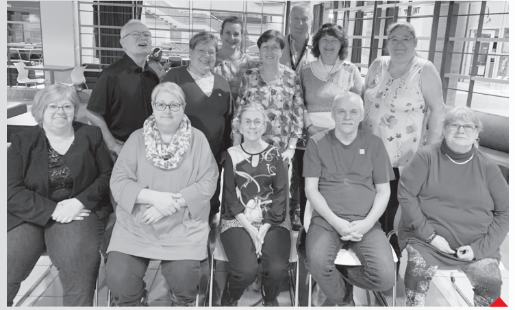
Les membres du conseil d'administration de la FLHLMQ.

Pour rejoindre votre délégué.e, il suffit de lui laisser un message au info@flhlmq.com ou au 1-800-566-9662 et il ou elle vous recontactera.