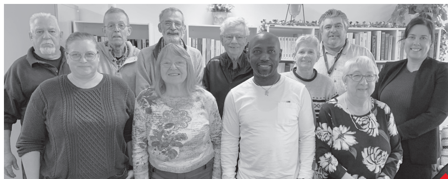
Des associations de locataires d'immeubles en AccèsLogis sont présentes au CCR de Sherbrooke.