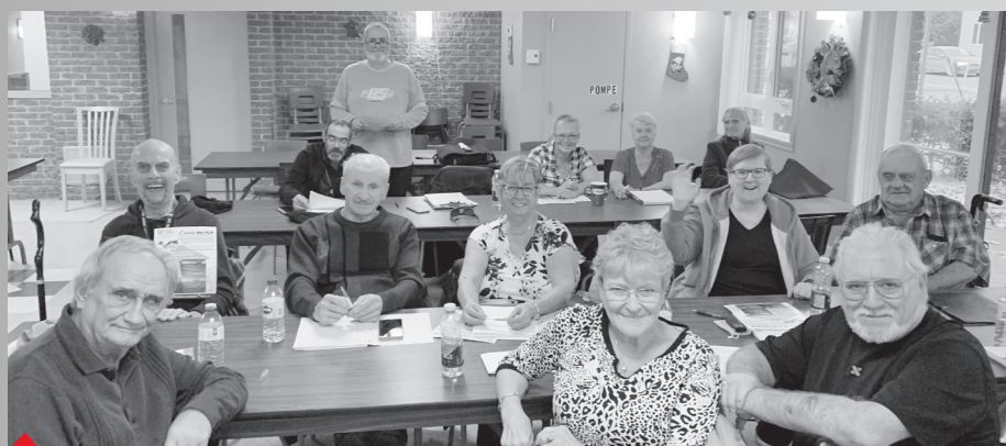
Une quinzaine de personnes actives dans les associations de locataires de Valleyfield ont participé à la formation.

La FLHLMQ a eu le plaisir de rencontrer 14 locataires actifs au sein de l'Office d'habitation de Valleyfield lors d'un après-midi d'échange et de formation, le 4 décembre 2024.