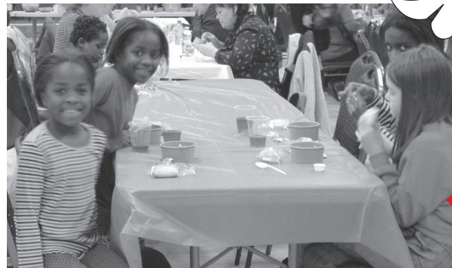
Une cinquantaine d'adultes et d'enfants ont participé à une belle activité qui redonne des ailes à l'association des locataires.

Buffet chaud traditionnel, musique et tirage de cartes-cadeaux ont permis d'égayer une soirée très appréciée pour les personnes âgées et les quelques