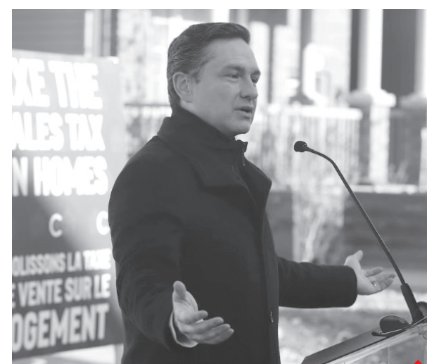
Le 28 octobre 2024, le chef du Parti conservateur du Canada a pris l'engagement de supprimer les fonds finançant les logements sociaux pour abolir la TPS sur les maisons neuves.

Consultez notre site flhmq.com pour prendre connaissance des engagements des autres partis concernant le logement social.