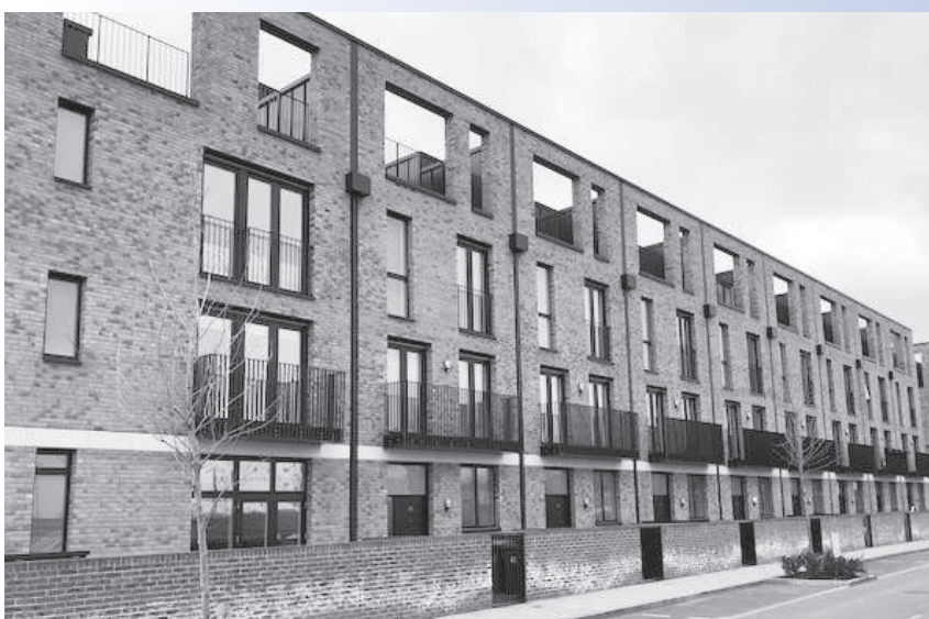
HLM à Londres

Plus de 1,2 million de familles attendent d'obtenir un logement social et le nombre de sans-abri a atteint un record l'an dernier à Londres.