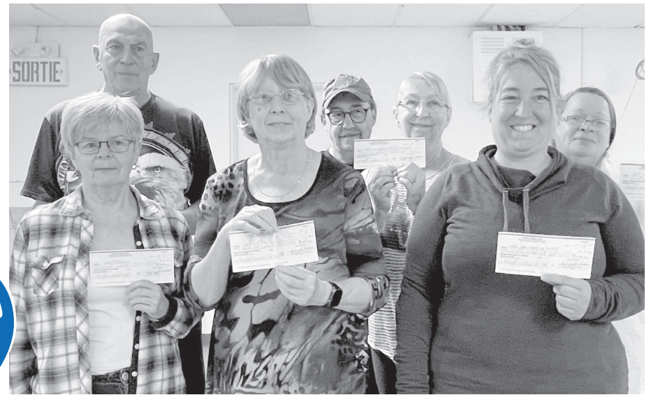
Plusieurs immeubles bénéficieront d'une aide financière du CCR.

Suite à un appel de projets ouvert aux associations de locataires et aux représentant-e-s d'immeubles, le CCR de Trois-Rivières a distribué une somme de 10 552,07$ pour financer des initiatives qui encouragent la vie associative dans les HLM.