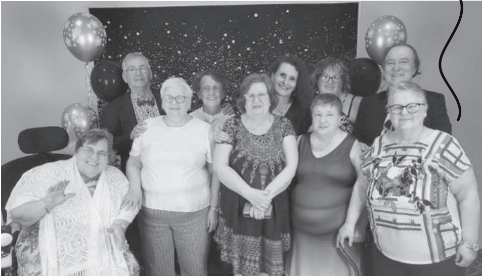
Des locataires du CCR de Québec.

L'engagement bénévole peut être exigeant. C'est donc important de remercier et valoriser ce bénévolat...une activité à la fois, un bénévole à la fois. Il n'y a pas de petites implications.