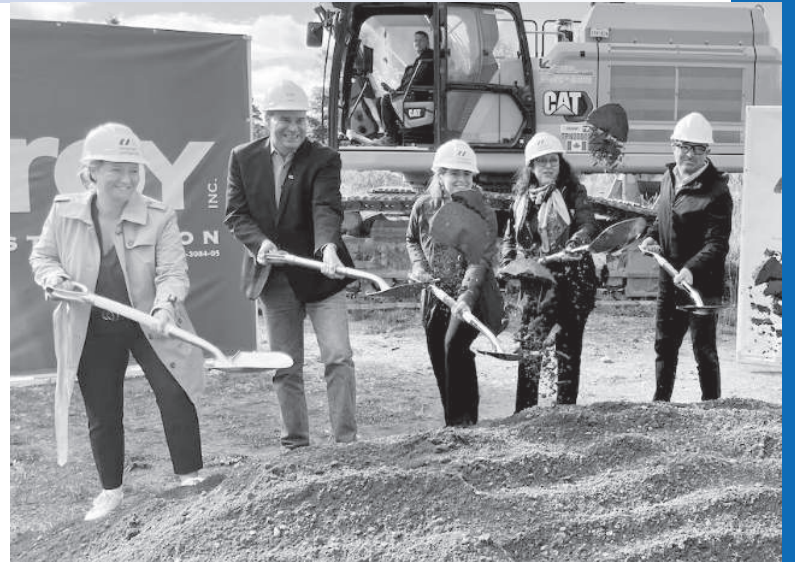
Première pelletée de terre à Rimouski.

Du même coup, cette initiative en provenance d'une fondation privée, à qui la SHQ a donné 235 millions $, nous fait cependant réaliser combien il est scandaleux que les offices d'habitation, qui sont les principaux mandataires de la SHQ depuis 50 ans, doivent dépendre des efforts des autres et ne puissent pas développer eux-mêmes leurs propres logements HLM.