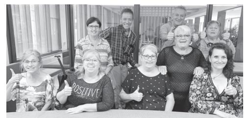
Une partie des quinze membres du CA de la FLHLMQ.

Beaucoup de pain sur la planche mais le moral est excellent !