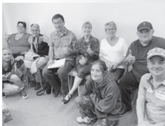
Les membres de l'Association des locataires de Val-des-Sources.

Cette nouvelle aventure à Val-des-Sources pose évidemment la question de la relève mais aussi les façons de travailler conjointement entre les différentes générations en utilisant les forces de chacun, que ce soit au sein d'une même association ou au sein du comité consultatif des résident-e-s.