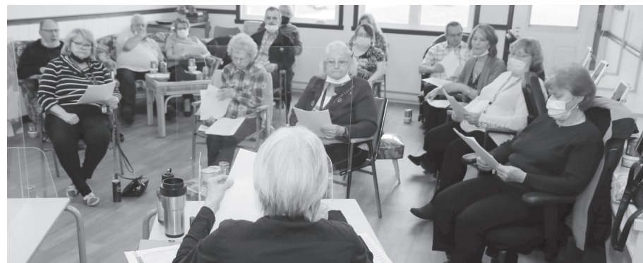
Les locataires réunis en assemblée générale au Lac Mégantic.

Le plan prévoit une grande fête de fin d'été, des formations pour utiliser des tablettes mais aussi différentes activités pour bien représenter les locataires auprès de l'office. Ainsi, tous les locataires savent ce qu'il se fera dans la prochaine année pour l'avoir eux-mêmes décidé. Si certaines actions déplaisent par la suite, il sera difficile de jeter le blâme sur les seuls membres élu-e-s du comité.